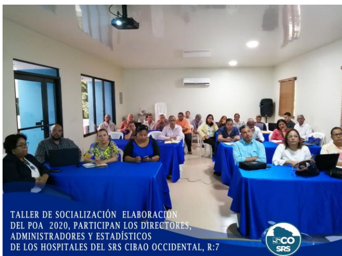
TALLER DE SOCIALIZACIÓN ELABORACIÓN DEL POA 2020, PARTICIPAN LOS DIRECTORES, ADMINISTRADORES Y ESTADÍSTICOS DE LOS HOSPITALES DEL SRS CIBAO OCCIDENTAL, R:7