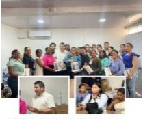
El SRS Cibao Noroeste a través del departamento de Gestión Clínica y el 1011, hacen entrega de equipos tecnológicos a promotores y operarios del programa orientado a resultados de tuberculosis.