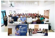
“El recurso humano es el corazón del sistema de salud. Con su vocación y compromiso, logramos impactar positivamente la vida de los ciudadanos que acuden en busca de atención”, expresó el Dr. Pedro Rodríguez durante su intervención.