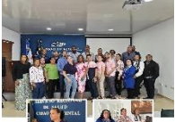
SNS imparte taller de mejora de la calidad HEARTS a los trabajadores del Primer Nivel de Atención del SRS Cibao Noroeste