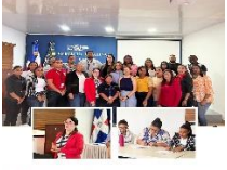
El Departamento de Gestión Clínica del SRS Cibao Noroeste organiza una mesa de trabajo con el personal de los servicios de atención integral