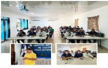
La División de RR.HH. del SRS Cibao Noroeste realiza Capacitación sobre Ética Profesional