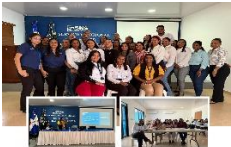
Observación de rigurosidad en los registros de RRH de las FES sobre el correcto registro de licencias médicas