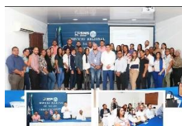
Taller de Humanización de los Servicios en la Atención al Paciente