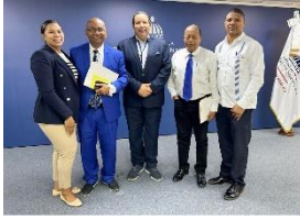
Gerencias de Área de la región Cibao Noroeste, participan en la capacitación del Enfoque de Curso de Vida