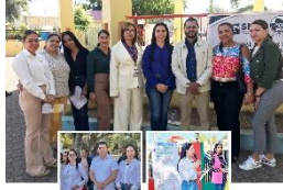
Jornada de concientización sobre la depresión e intento suicida