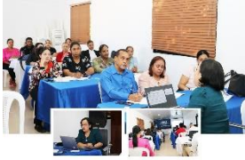
Reunión de Socialización del Plan Operativo Anual (POA) 2025