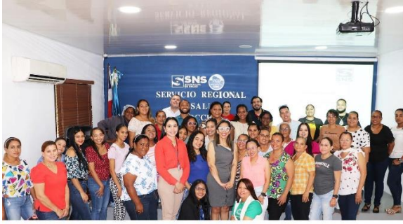
"SRSCO IMPARTE TALLER DE AMPLIACIÓN DE LA ESTRATEGIA MHGAP" DEPARTAMENTO DE SALUD MENTAL SRSCO - RZ.