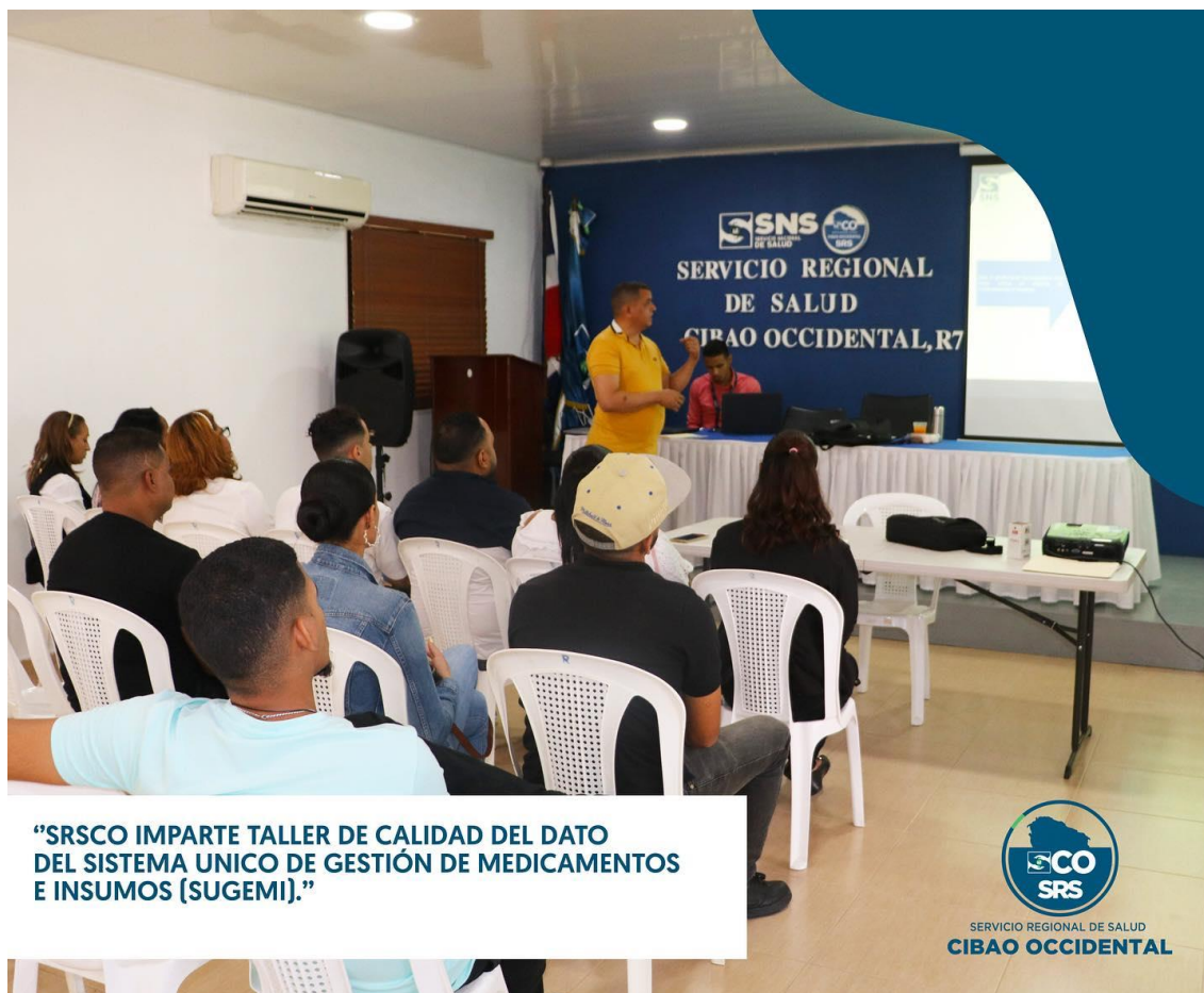
“SRSCO IMPARTE TALLER DE CALIDAD DEL DATO DEL SISTEMA UNICO DE GESTIÓN DE MEDICAMENTOS E INSUMOS (SUGEMI).”

Dirigido a: Almacén Regional de Medicamentos.