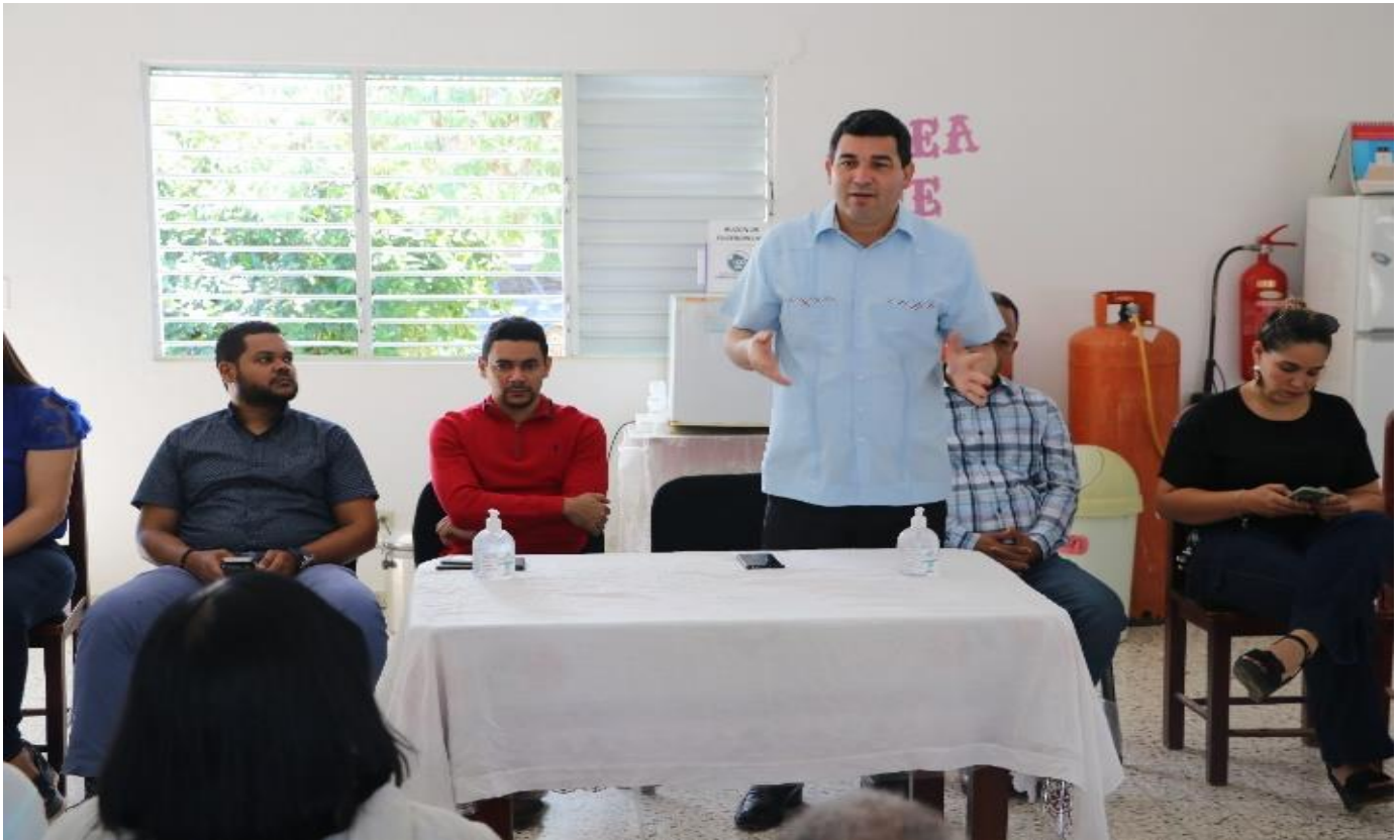
SRSCO, REALIZA ACTIVIDAD DE CAPACITACION CON LOS EPIDEMIOLOGOS DE LOS HOSPITALES, GERENTE ASISTENCIALES Y COORDINADORES DE ZONA DE LA REGION. SOBRE VIGILANCIA EPIDEMIOLOGICA. 9 de marzo, 2022.