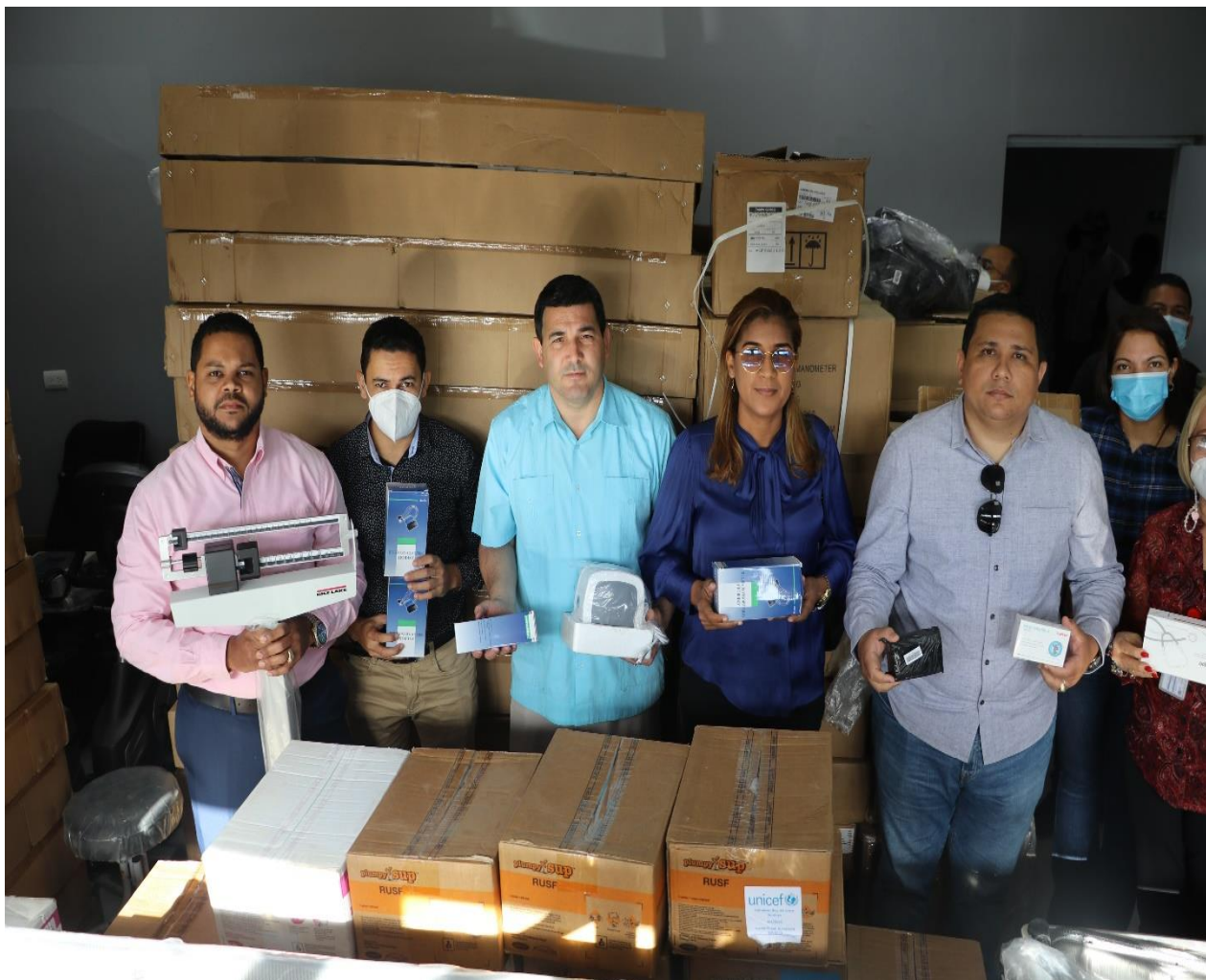
El Servicio Regional De Salud Cibao Occidental (SRSCO), Realiza reunión con los directores de los centros hospitalarios de la región noroeste. 7 de marzo, 2022.