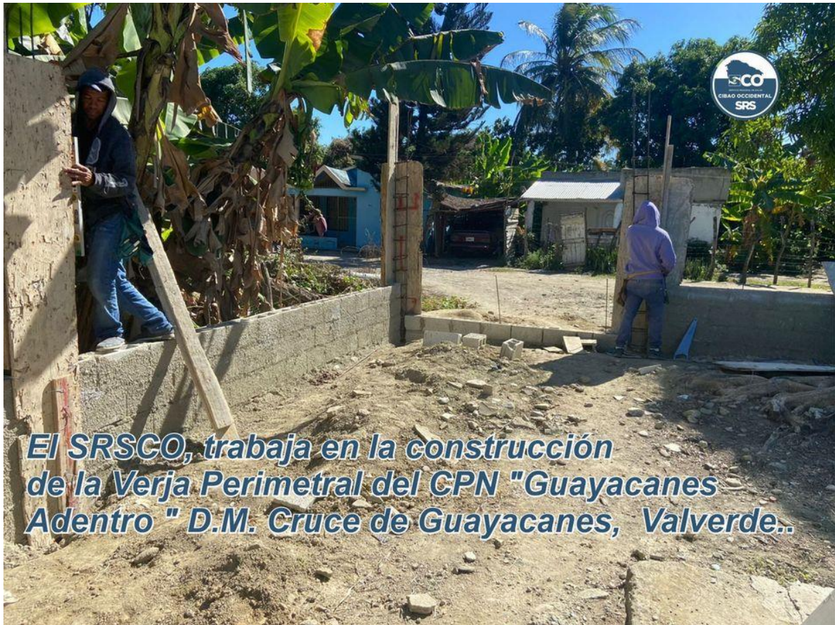
El SRSCO, trabaja en la construcción de la Verja Perimetral del CPN "Guayacanes Adentro " D.M. Cruce de Guayacanes, Valverde..

SRSCO, se reúne con directores/as de hospitales de la región.