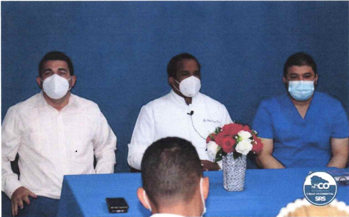
SNS-SRSCO, posicionan directora de hospital.